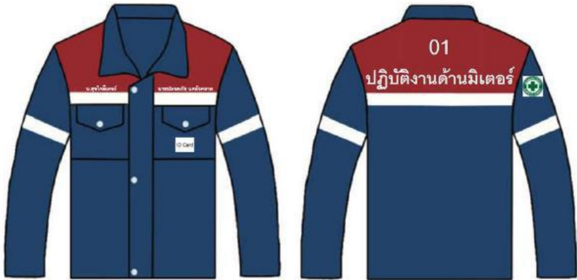
ตัวอย่างเสื้อสีแดง