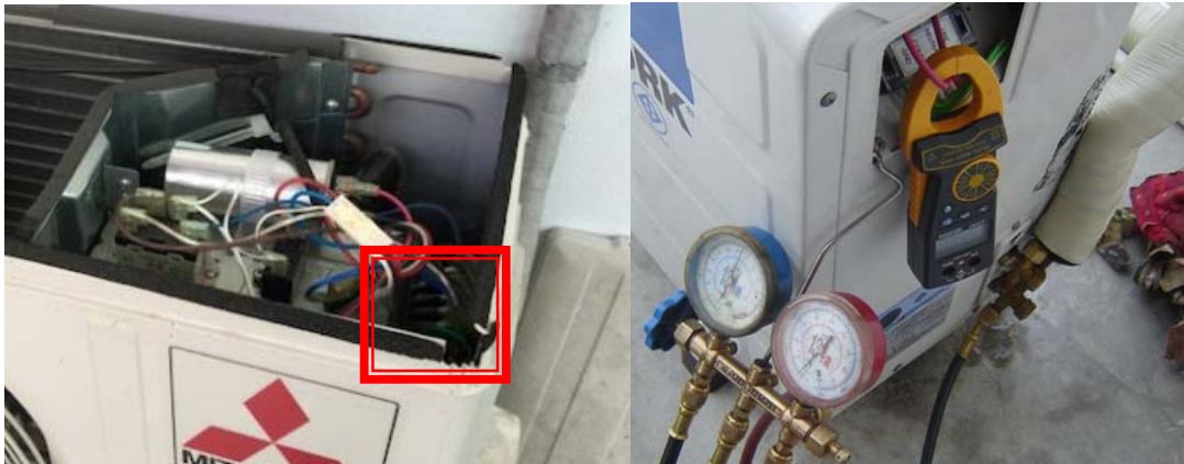
จุดที่ทำการตรวจวัดค่ากำลังไฟฟ้า ณ คอมเพรสเซอร์