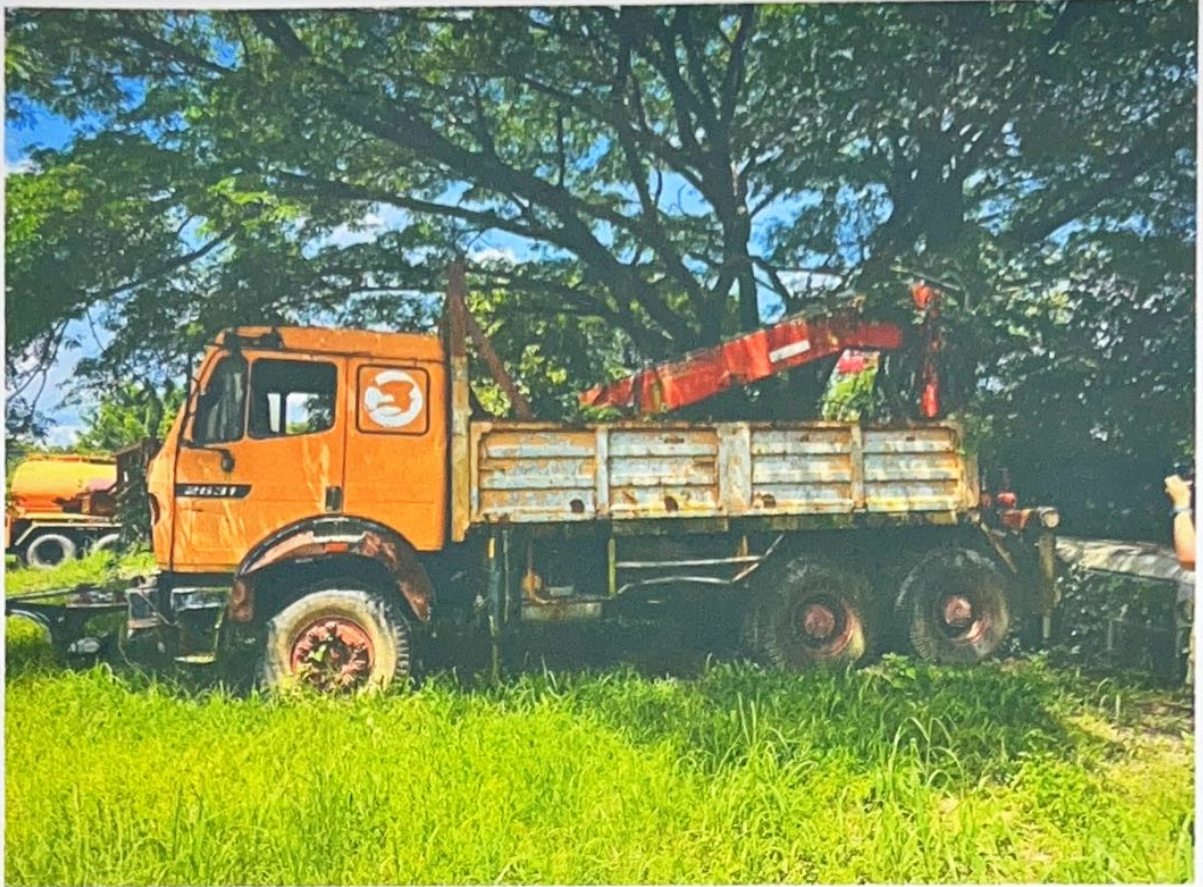
รถยนต์ทะเบียน 81-8192 อบ.