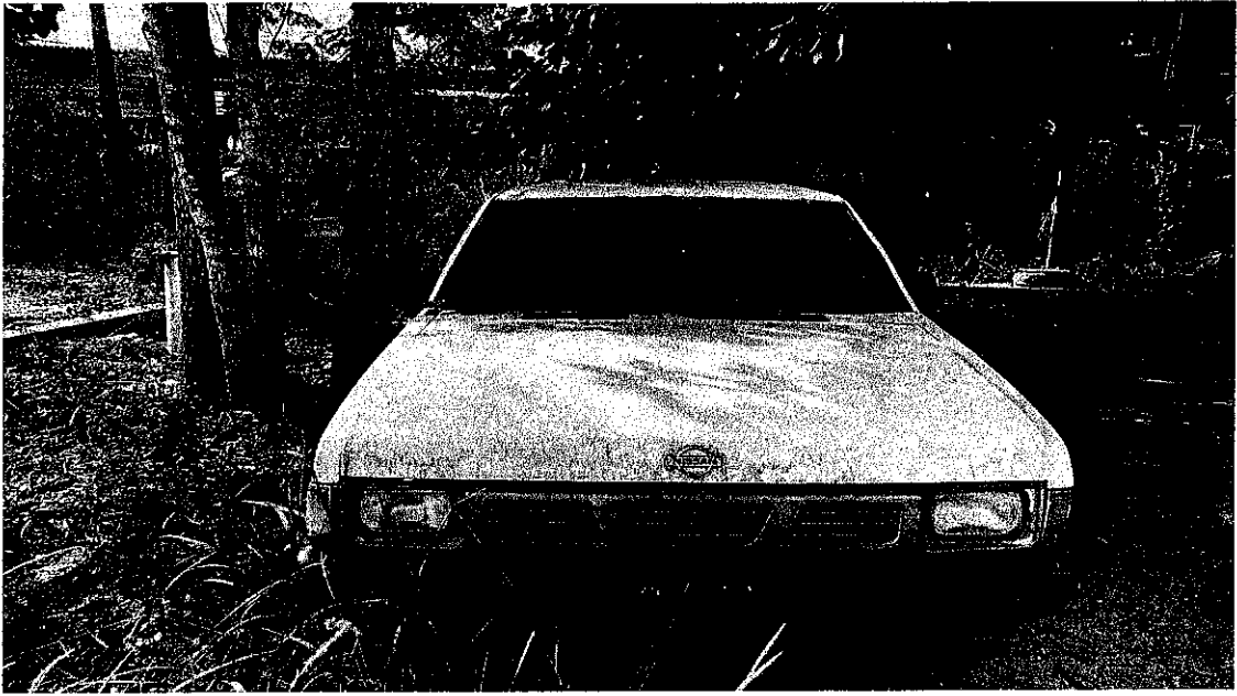
รถยนต์กระบะบรรทุก ยี่ห้อนิสสัน 4 ประตู ทะเบียน กข.1760 ระยอง